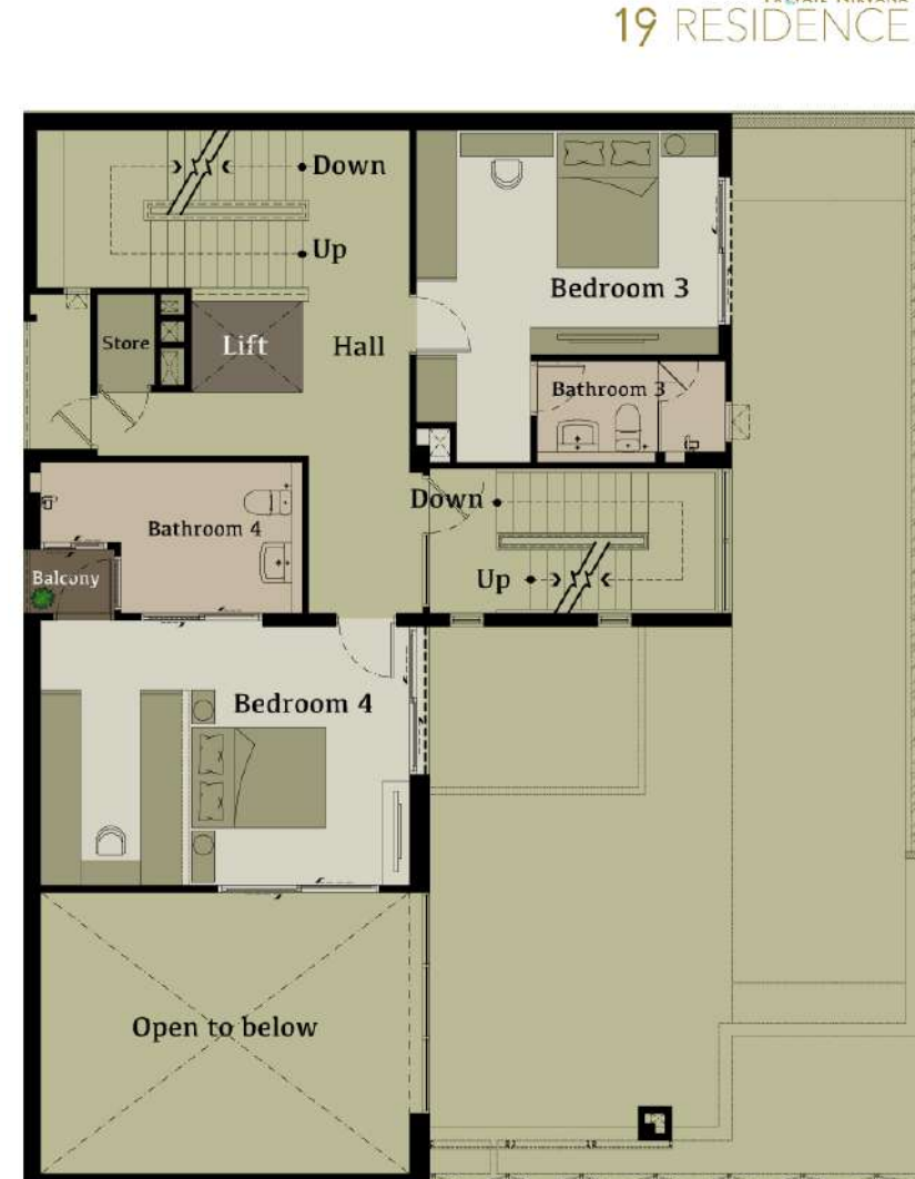
3 rd Floor Plan

พื้นที่นี้ใช้แบบ Double volume ภายนอกแบบ "open plan" หรือภายในแบบ "Separate" เป็นไปตามข้อกำหนดของพื้นที่สีเขียวชั้น 2 กับ Roof Garden ชั้น 5 *เฉพาะแบบ RILL จะมีสระว่ายน้ำขนาด Exercise Pool ราว 13.50 เมตร สระนี้จะเชื่อมกับระบบน้ำอัตโนมัติ