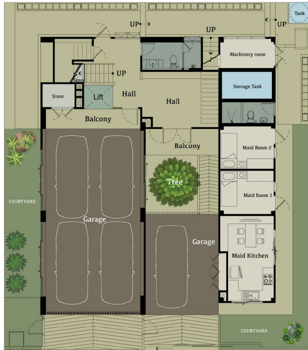
Ground Floor Plan

บ้าน 5 ชั้น พื้นที่ไร่ละ 830 Sqm. จอดรถ 5 คัน Garage life...ติดตั้ง air condition มีจุดติดตั้งหัว charge รถไฟฟ้า โดยพื้นที่จอดรถนี้ถูกออกแบบมาให้สามารถรองรับรถสำหรับคนรักรถ