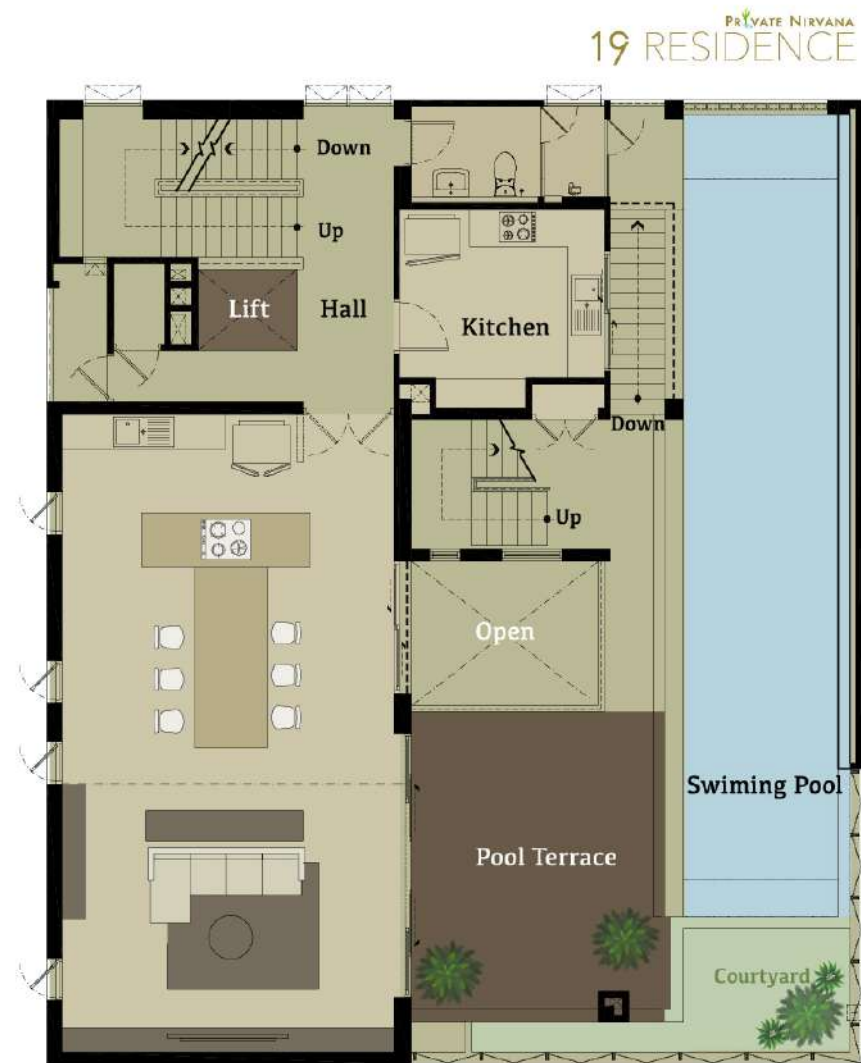
2 nd Floor Plan

บ้าน 5 ชั้น พื้นที่ไร่ละ 830 Sqm. จอดรถ 5 คัน Garage life...ติดตั้ง air condition มีจุดติดตั้งหัว charge รถไฟฟ้า โดยพื้นที่จอดรถนี้ถูกออกแบบมาให้สามารถรองรับรถสำหรับคนรักรถ