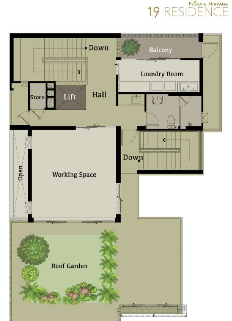
5 th Floor Plan

รวมต้นอากาศสะอาดภายในบ้าน กับพร้อมที่ระบบชั้นขึ้น ระบบ ความสะอาดภายใน ยังสะดวกต่อระบบ อุปกรณ์อื่น ๆ อีกด้วย