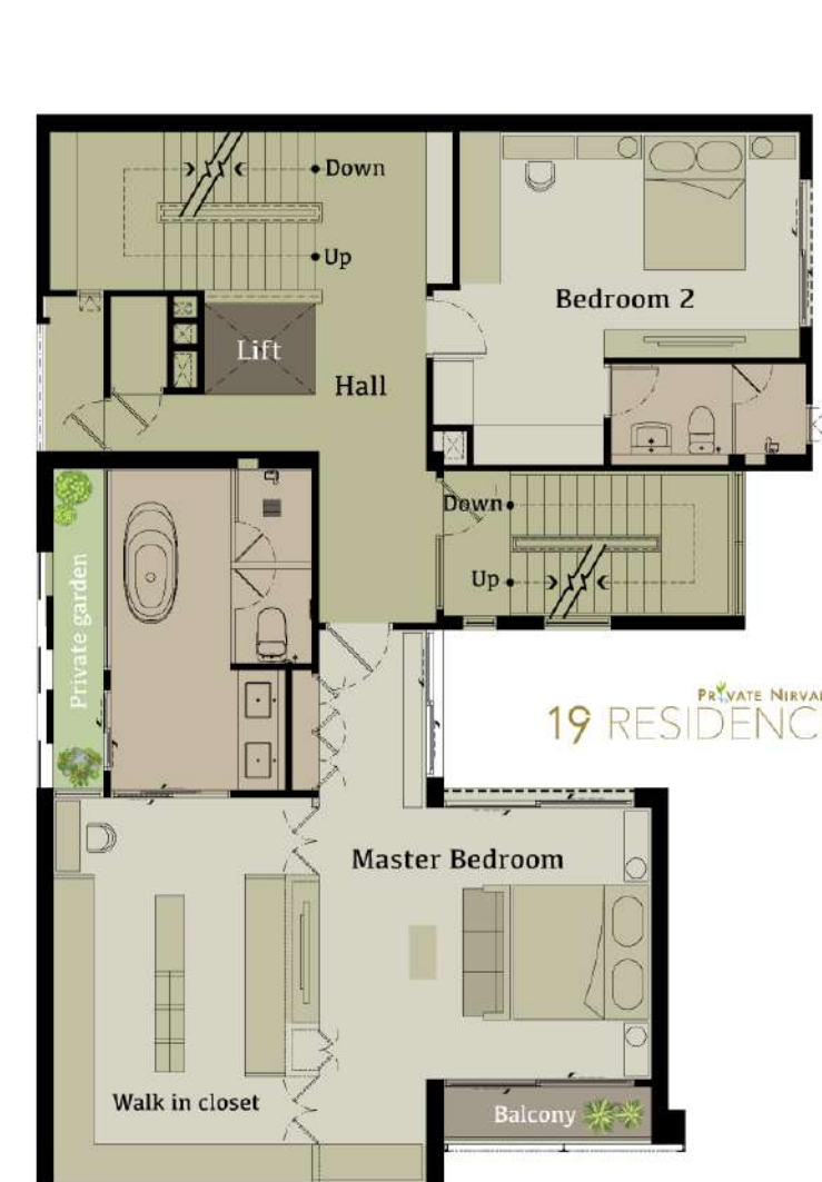
4 th Floor Plan

แยกจากส่วนที่อยู่อาศัยหลักของบ้านของชั้น 2,3,4 ทำให้ทั้งห้องนอนและงาน ต่างก็มีความเป็นส่วนตัว ชั้น 3 ห้องจะถูกออกแบบมาให้สามารถรองรับผู้สูงอายุที่ใช้ wheel chair ได้